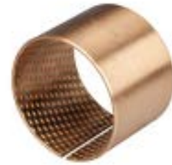
ID and OD chamfers